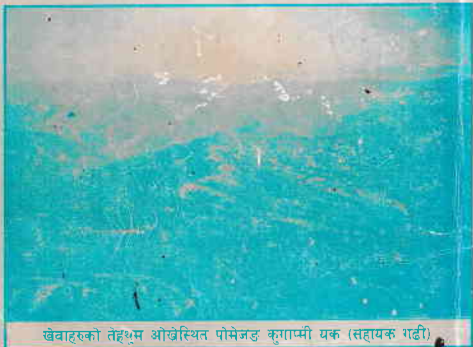
खेवाहरुको तेह्रथुम ओख्रेस्थित पोमेजङ कुगाप्मी यक (सहायक गढी)