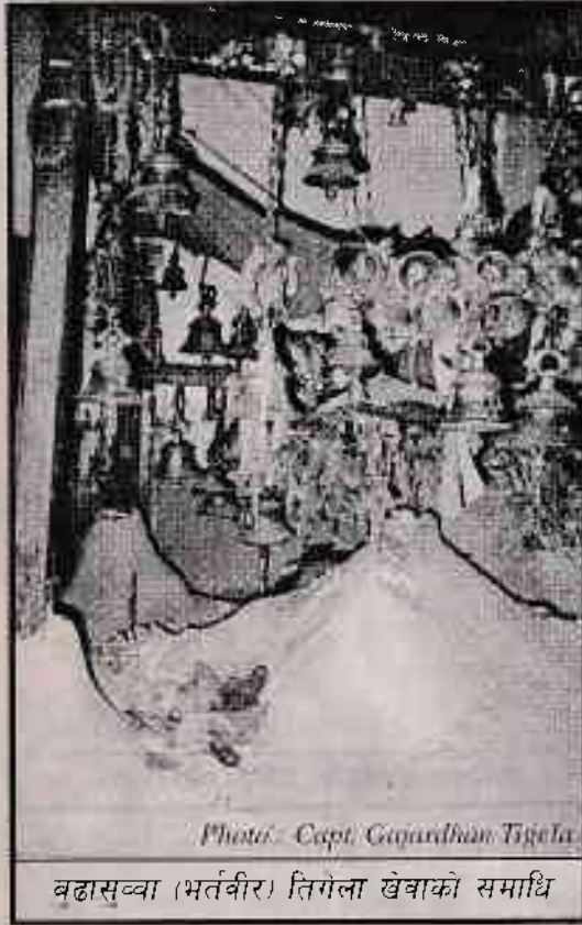
बढासुवा (भर्तवीर) तिगेला खेवाको समाधि

पूर्वाञ्चलको धनकुटा जिल्ला अन्तर्गत पर्ने हात्तीखर्क गाउँ विकास समितिमा वर्तमान स्थितिमा विविध जातीहरूको बसोबास भएता पनि किरात मूलका लिम्बूहरूको पनि बसोबास रहेको छ । जसमध्ये तिगेला खेवा वंश पनि एक हो । यिनै तिगेला खेवा वंशका प्रथम तिगेला खेवाका