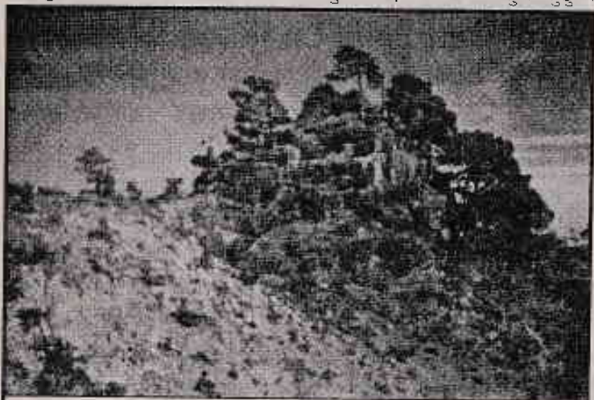
थाक्लुङ्ग (ताक्लुङ्ग) खेवा लिम्बूहरूको एक (गढी)

पछिवाट कृपियुगमा आएपछि, पुराहरू कमाइ खेतिगर्ने र ओढार छोडेर घर बनाएर बस्न थालेपछि त्यो हाडवाट केहि र कि मी तलभरि बस्ती बनाएर बसे । आफ्ना वगैचा समेत लगाउन थालेका प्रमाण दस, बाह्रसय वर्ष पुरानो आफिकोरुख अभै मरेको छैन । कृपियुगमा आइपुगेपछि उनिहरू धेरै फैलिसकेका हुनाले एउटै वंशमा कुल कुटुम्ब